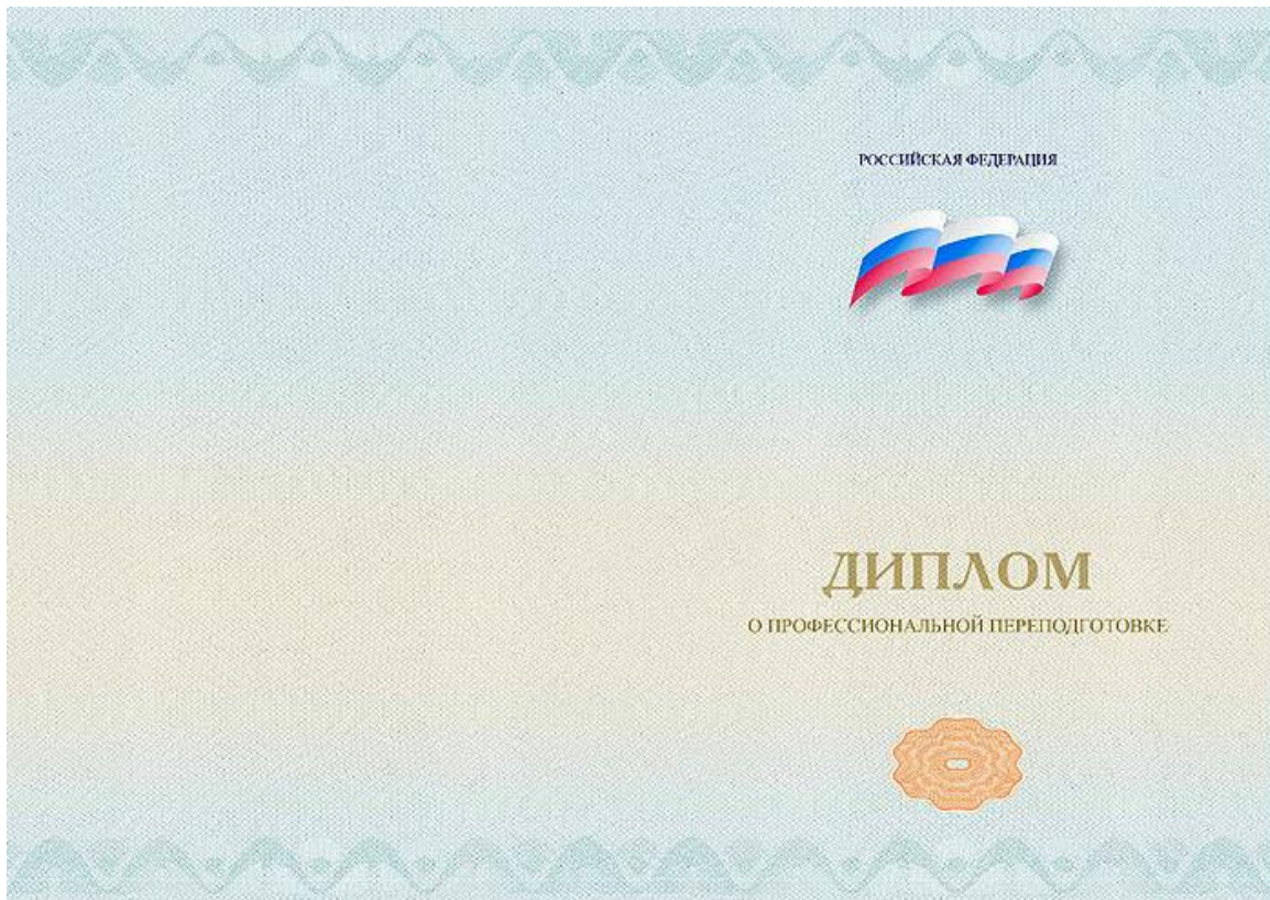
Приложение 5 Титул диплома о профессиональной переподготовке (размер А4)