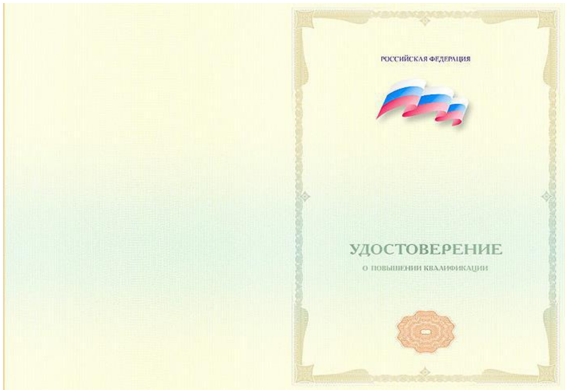
Приложение 1 Титул удостоверения о повышении квалификации (размер А4)