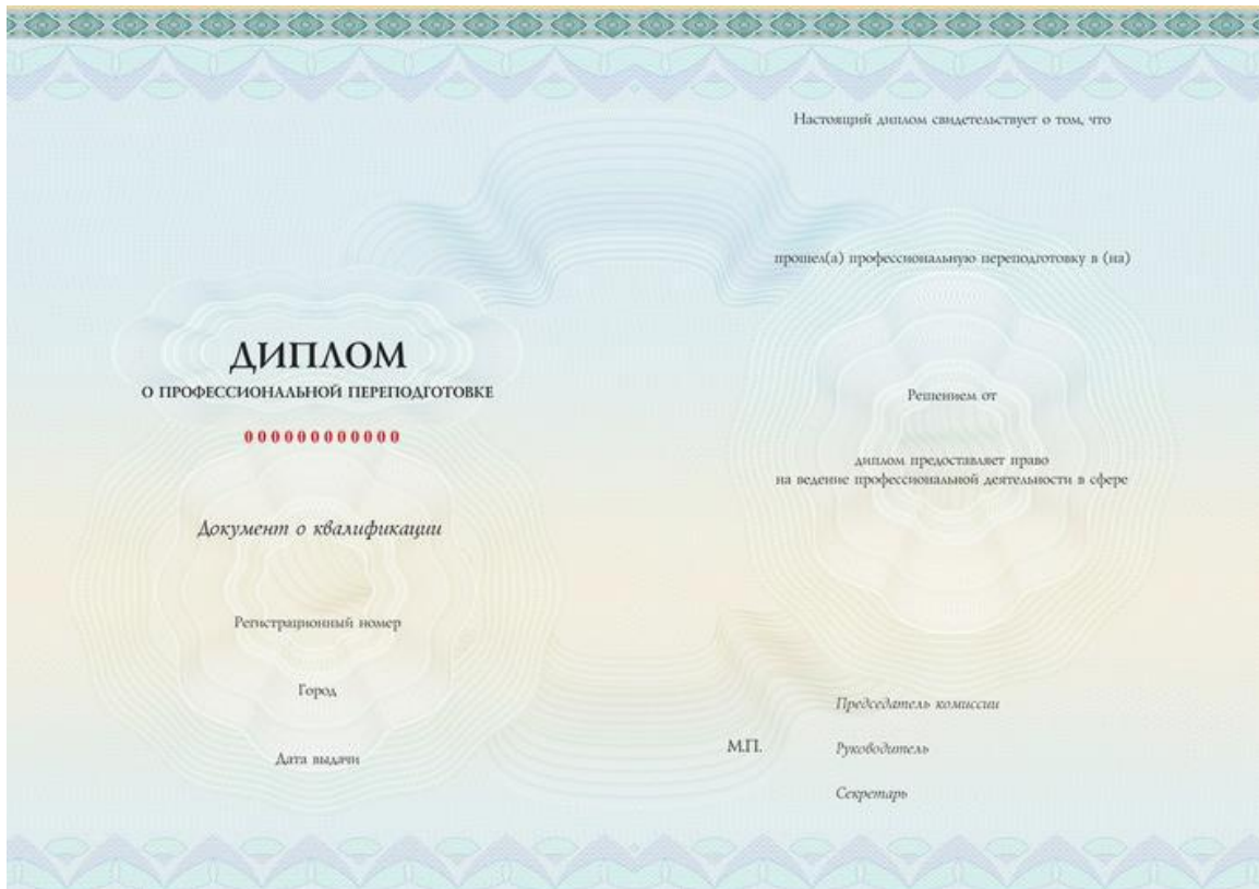
Приложение 6 Разворот диплома о профессиональной переподготовке (размер А4)