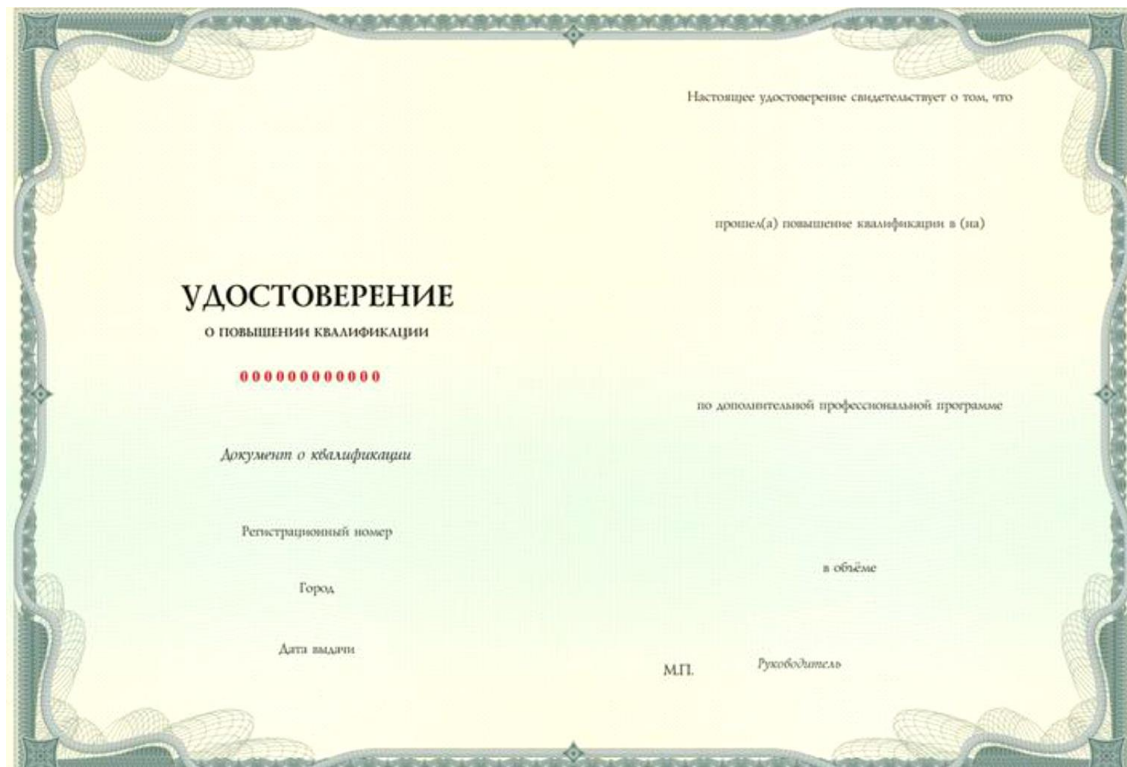
Приложение 2 Разворот удостоверения о повышении квалификации (размер А4)